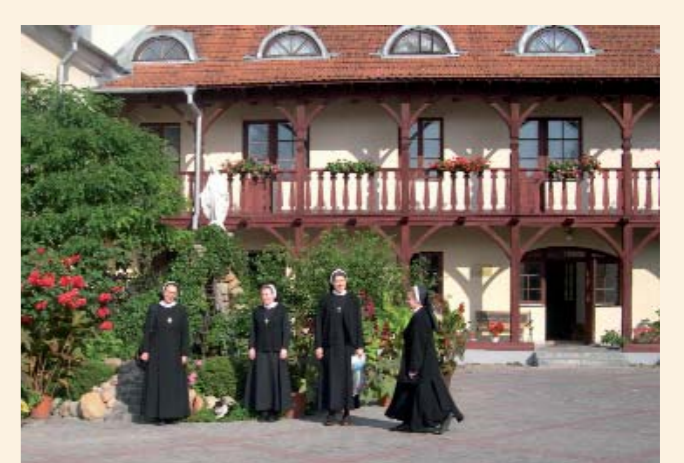
Grodno - kuria

I to jest cały sekret tej ziemi dalekiej, Owianej mgłą zieloną najzieleńszej rzeki, Jaką jest szmaragdowy Niemen, który tędy Przepływa, zamykając kraj kręgiem legendy.