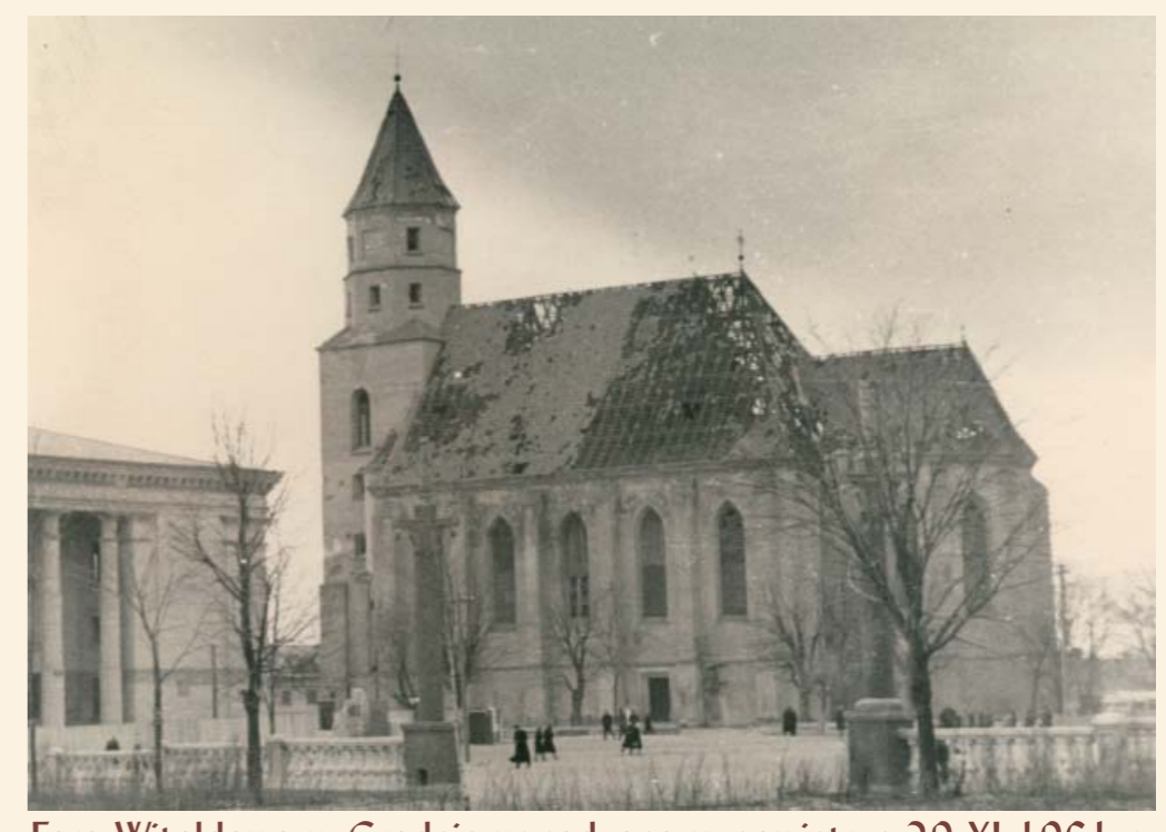
Fara Witoldowa w Grodnie wysadzona w powietrze 29 XI 1961 r.