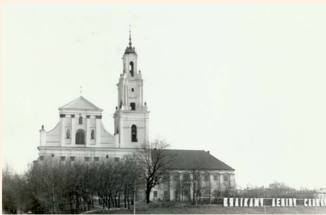
Kościół pobernardyński w lenińskim kontekście